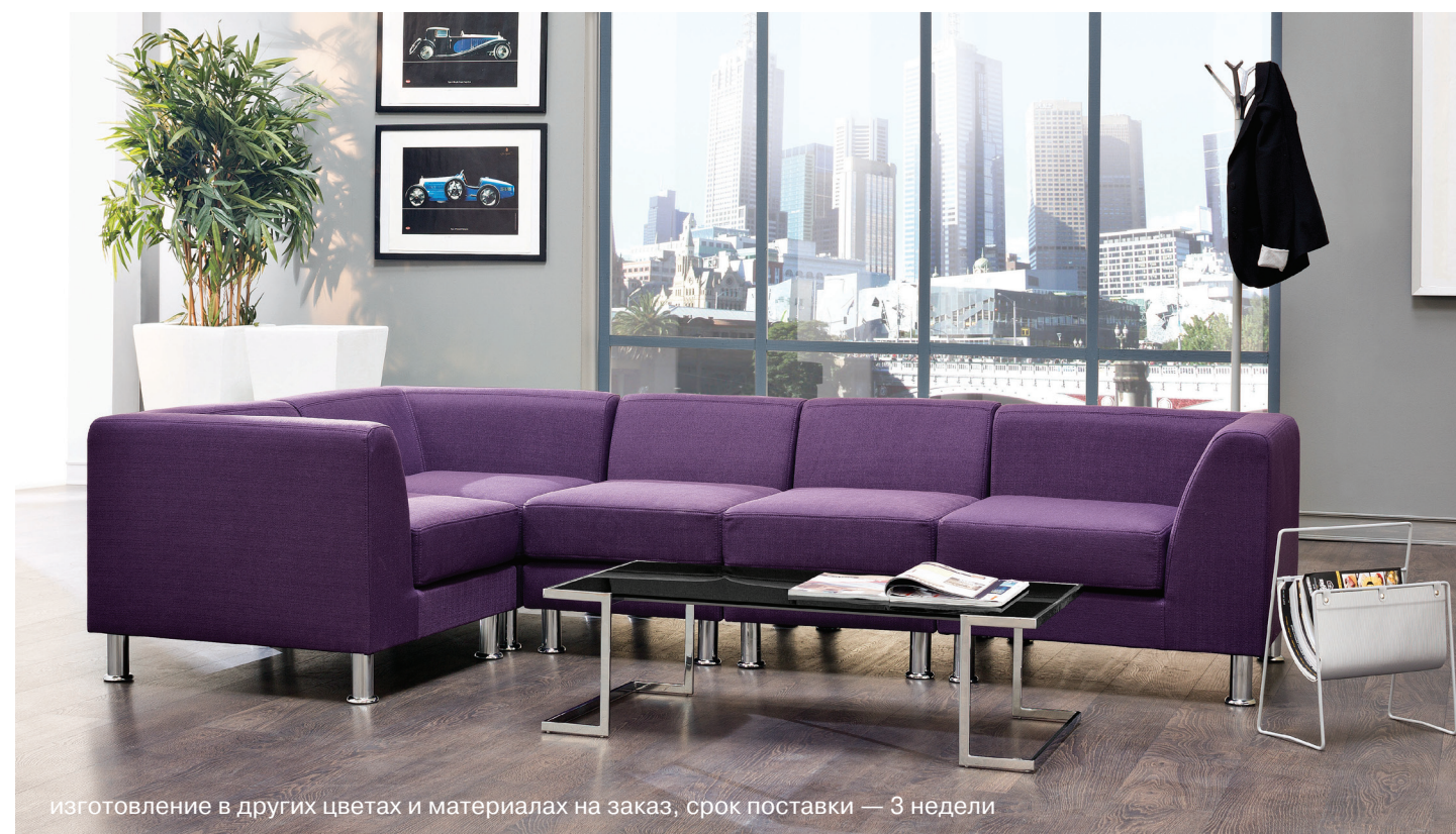
изготовление в других цветах и материалах на заказ, срок поставки — 3 недели