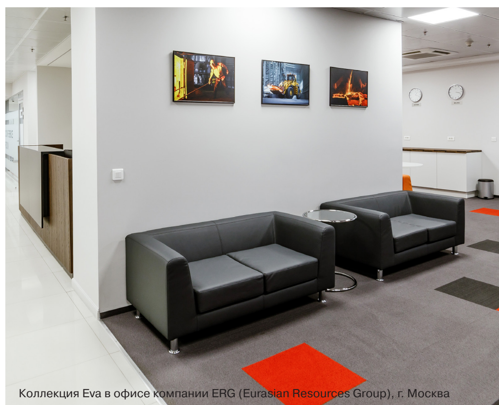
Коллекция Eva в офисе компании ERG (Eurasian Resources Group), г. Москва