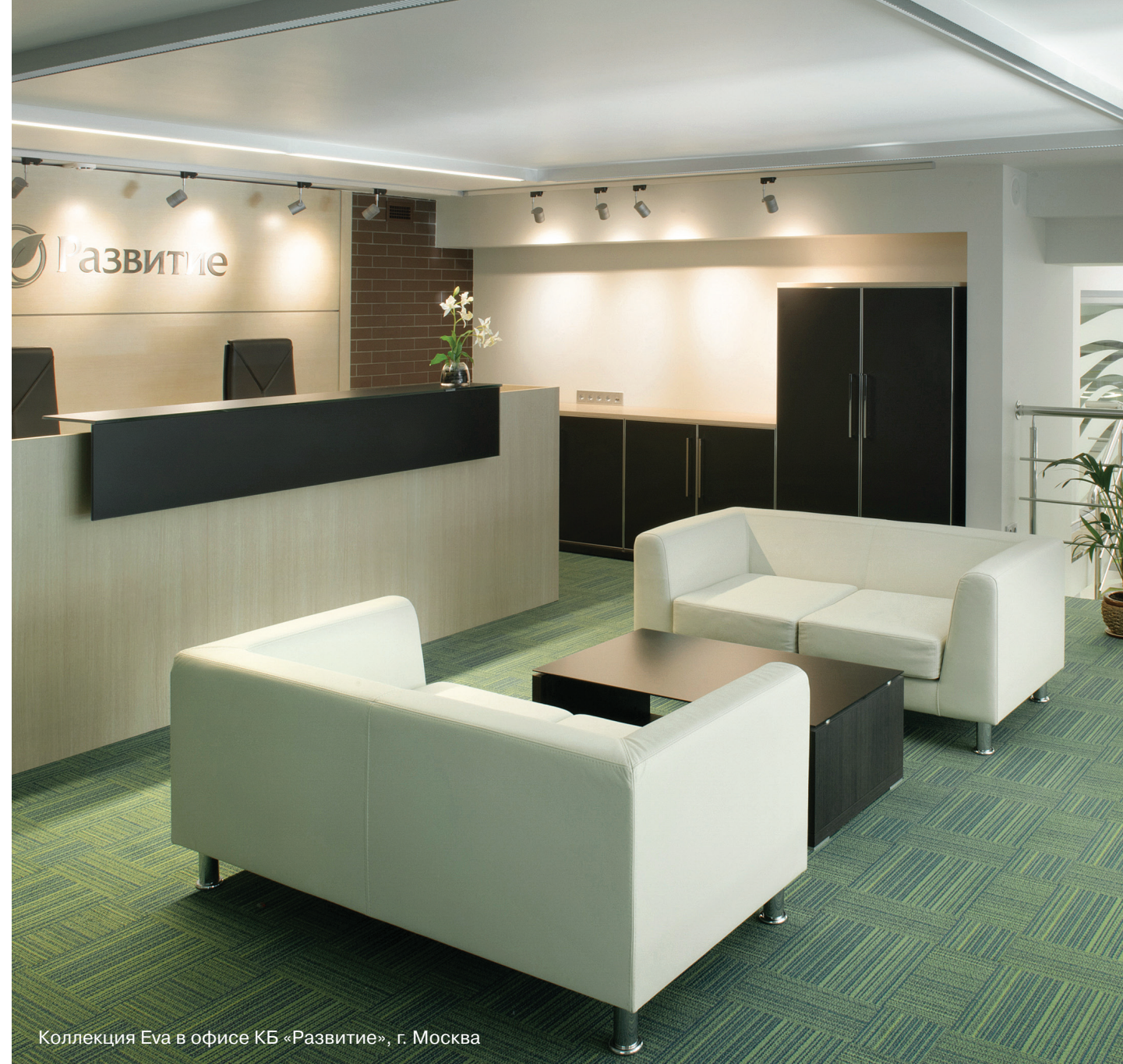
Коллекция Eva в офисе КБ «Развитие», г. Москва