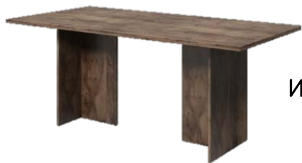
Стол переговоров L-101